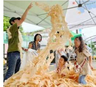
多摩産材を使ったカンナくずプール