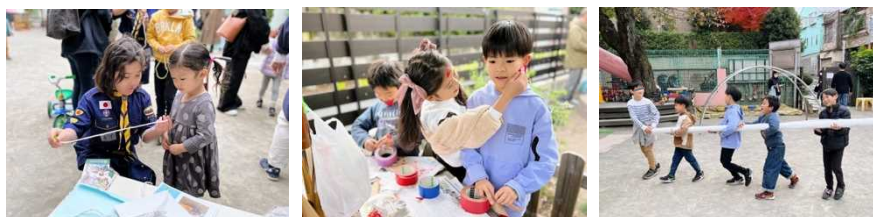
卒園児ボランティアの様子