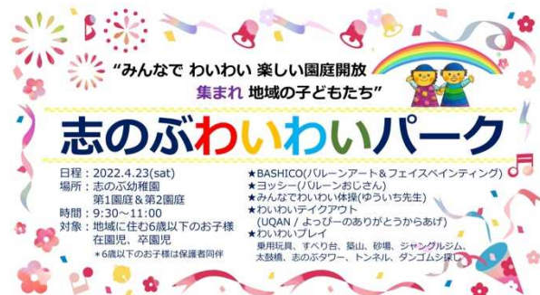
志のぶわいわいパーク初回のフライヤー

そこで2022年4月から、子どもの所属(幼稚園・保育所など)に関係なく、地域の大人と子どもたちが気軽に集い交流する場として、また子どもが地域の様々な資源と出会い自然体験など多様な経験を積み重ねながら育つ場として「志のぶわいわいパーク」をスタートさせた。この取り組みを通して、